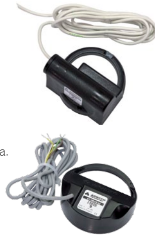
NAKŁADKA IMPULSOWA AT-MBUS-NE-01 / AT-MBUS-NE-03